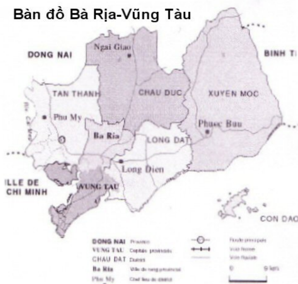
Bản đồ Bà Rịa-Vũng Tàu

Bà Rịa - Vũng Tàu là tỉnh nhỏ nhất các tỉnh Miền Đông Nam Bộ, năm 1991- 1992 gồm luôn hai tỉnh Ninh Thuận - Phan Rang và Bình Thuận - Phan Thiết; còn miền Đông Nam Phần thời Cộng Hòa không có hai tỉnh cuối miền Trung này. Diện tích chỉ 1à 1982.6 km 2 , nhưng dân số năm 2004 đã trên dân số tỉnh miền Đông diện tích lớn hơn là tỉnh Bình Dương (Thủ Dầu Một cũ), 897 600 người so với 883 200.