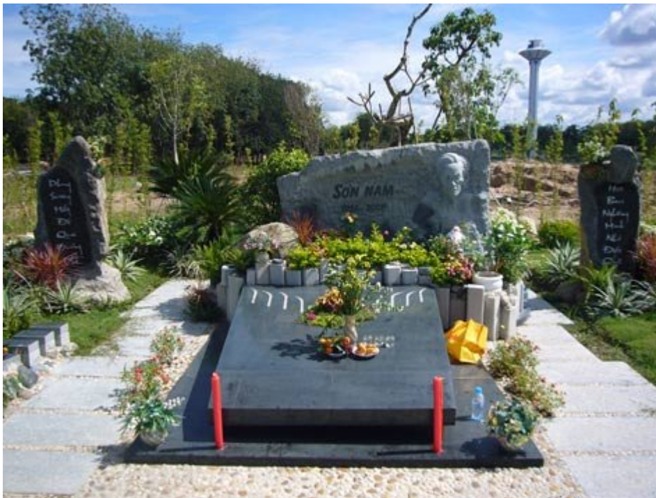
Ngôi mộ nhà văn Sơn Nam tại ấp 1B, xã Chánh Phú Hòa, Bến Cát, Bình Dương

Bên ngoài phần mộ có hai tảng đá to với hai câu thơ kết trong bài thơ “Không đề” do chính Sơn Nam sáng tác được viết thay lời tựa trong tác phẩm nổi tiếng Hương rừng Cà Mau . Bên trái “Phong sương mấy độ qua đường phố”, bên phải “Hạt bụi nghiêng mình nhớ đất quê”.